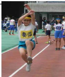
陸上フェスティバル

3つ当てはまれば前期前半、頑張れていると思います。あと少しの人は、この数週間の間頑張って3つになってほしいと思います。