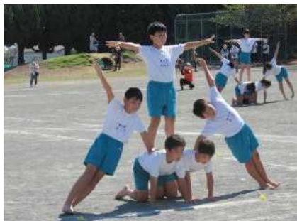
堂々たる組体操 6年生

同時に、たくさんの行事も今後予定されています。お子さんの健康管理をお願いします。